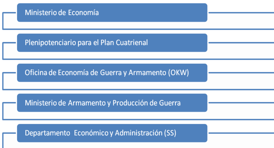
Gráfico 1. Organismos con esferas de influencia económica, 1939-1945